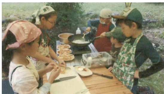
子ども達で昼食づくり