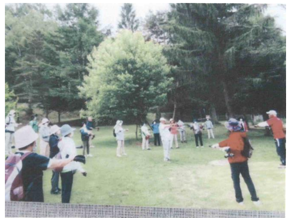
ポールウォーキング