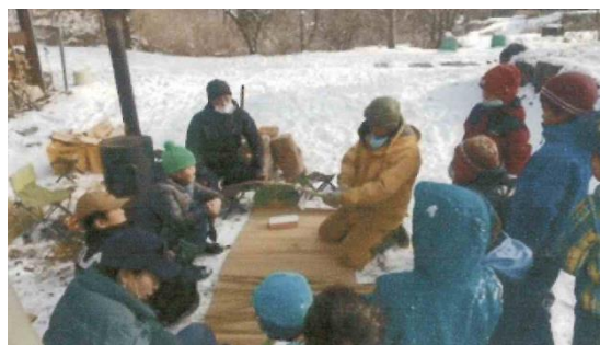
「牛蒡じめ」を教わる