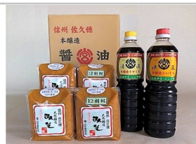
〔YK-01〕天然醸造みそ2種4kgと本醸造しょうゆ2種セット