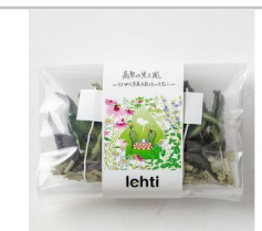
〔LF-01〕lehtiハーブティ「高原の光と風」2包入り