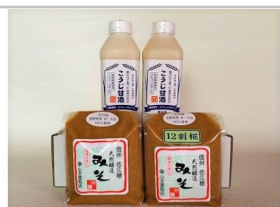
〔YK-04〕糀だけで造った甘酒2本と天然醸造みそ2種セット