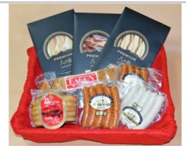
〔KH-05〕信州きたやつハムセット厳選8品セット