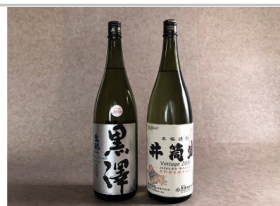
〔YO-01〕黒澤酒造ヴァンテージ