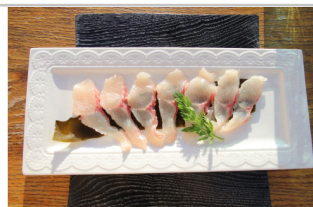
〔YG-06〕信州大王イワナ刺身用