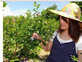
〔AK-01〕「季節の果物狩り体験券」1枚