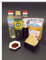
〔CH-01〕相馬醤油のこだわりセット