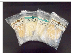
〔CH-03〕さくほ一めんセット

10日間塩水に漬け込み旨味を引き出した肉を、豊かな自然のなかで丁寧に加工した究極の味わい。本場ドイツを彷彿とさせる味わいをご堪能ください。