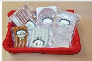
〔KH-15〕信州きたやつハムセット厳選5品セット