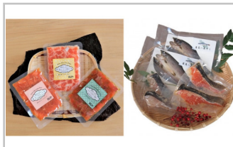
〔YG-07〕信州サーモン「醸師(KAMOSHI)」シリーズ