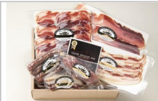
〔KH5-2〕信州きたやつハムセット生ハム・サラミセット