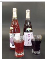
〔CH-05〕2種類の果汁ジュースセット

昼夜の寒暖の差がある八千穂高原の清風と、有機肥料を主体としたミネラル豊富な土壌で育ったリンゴを使用しております。