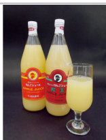
〔CH-04〕2種類のリンゴジュースセット

佐久穂町産のお米を使用し、佐久穂町産馬鈴薯のでんぶんのみで作った麺（さくほ一めん）。もちもち食感をお楽しみください。