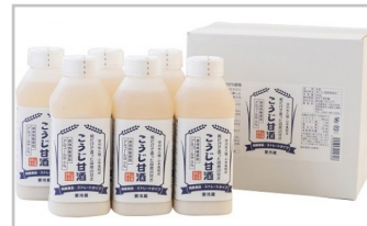
〔YK-03〕糀だけで造った甘酒520g6本セット