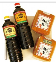
〔YK-05〕天然醸造みそ2種と本醸造しょうゆ2種セット