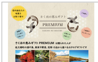
〔YO-12〕「さくほの恵みギフトPREMIUM」1枚