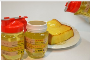
〔YY-01〕信州特産!!「国産純粋天然はちみつアカシア」