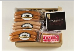
〔KH2-1〕信州きたやつハムセットプチギフトセット