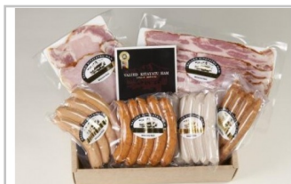
〔KH3-2〕信州きたやつハムセットお試しセット