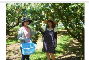
さくほの贈りもの(ギフト)18枚+季節の果物狩り体験券1枚+その他お礼の品