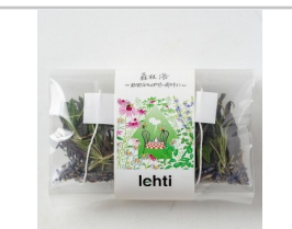
〔LF-02〕lehtiハーブティ「森林浴」2包入り