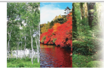
さくほの贈りもの(ギフト)9枚+季節の果物狩り体験券1枚