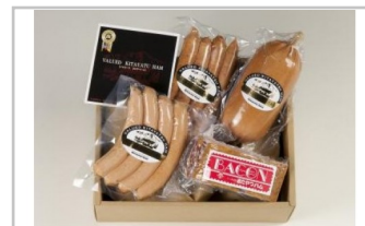
〔KH3-1〕信州きたやつハムセット基本セット