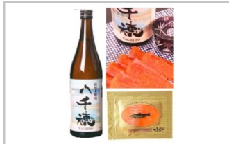
〔YO-10〕八千穂に乾杯!セット