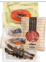
〔YG-05〕大石川の恵みセット05〈人気の信州サーモンなど5品〉