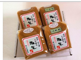
〔YK-02〕天然醸造みそ2種1kg×4個セット