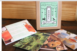
〔YO-13〕信州南佐久から贈るカタログギフト白駒の郷ギフト1セット