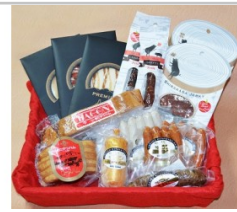
〔KH-02〕信州きたやつハムセット厳選14品セット