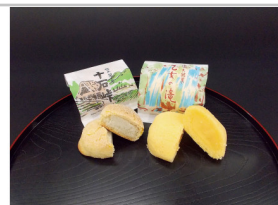
〔CH-06〕老舗の銘菓詰合せ

鉄分が豊富で栄養価も高い太陽の果実、もぎたてのブルーベリーで作ったジュース。地元産のみで作ったブルーベリージュースもご賞味ください。