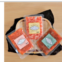
〔YG-08〕信州サーモン「醸師(KAMOSHI)」セット