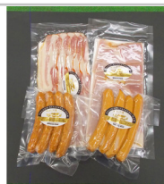
〔CH-02〕きたやつハム詰合せセット

こだわりのみそは、県産大豆10に対し県産米12の割合で麴にして仕込み、約1年間天然発酵、熟成させた吟醸限定品です。