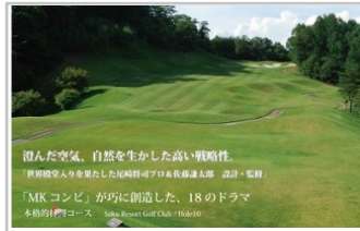
〔SR-01〕信州佐久リゾートゴルフ倶楽部プレー代優待券