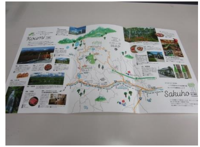
白駒の郷（観光パンフレット作成）