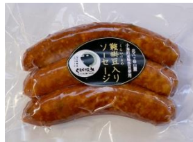
鞍掛豆ソーセージ