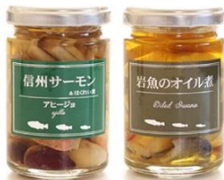
アヒージョ・オイル煮