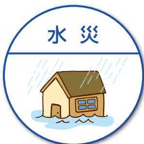
洪水や床上浸水など