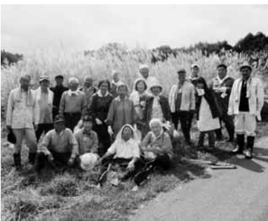
晴天の中でのススキ刈り

9月11日に府中市青少年健全育成対策第四地区委員会の皆さん14名が、町内佐口集落でススキ刈りを行いました。この行事は、青少年健全育成活動の一環として、古来の伝統行事を傳承し、親子のふれあいを深めるために府中市が毎年行っています。 佐久穂町からも会員が参加し、約八千本のススキを刈り取りました。