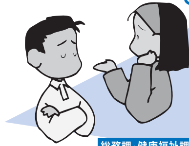
総務課・健康福祉課

そして法律専門職である司法書士が、自殺の引き金となる社会的要因に對して、個別具体的に法的な解決方法についての助言を行います。