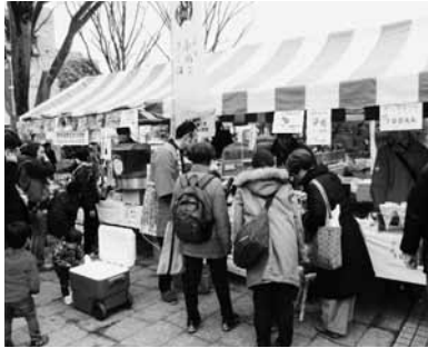
桜の下で佐久穂をPR

4月2日、3日に府中市民桜まつりが府中公園で開催され、佐久穂町のPRと特産品の販売を行いました。満開の桜の中で、大勢のお客様で賑わいました。また、特産品に加え、八千穂高原の雪を持っていき、触ったり遊んだり子どもを中心に大勢の方に喜んでいました。