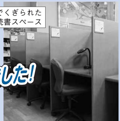
ブースでくぎられた学習・読書スペース