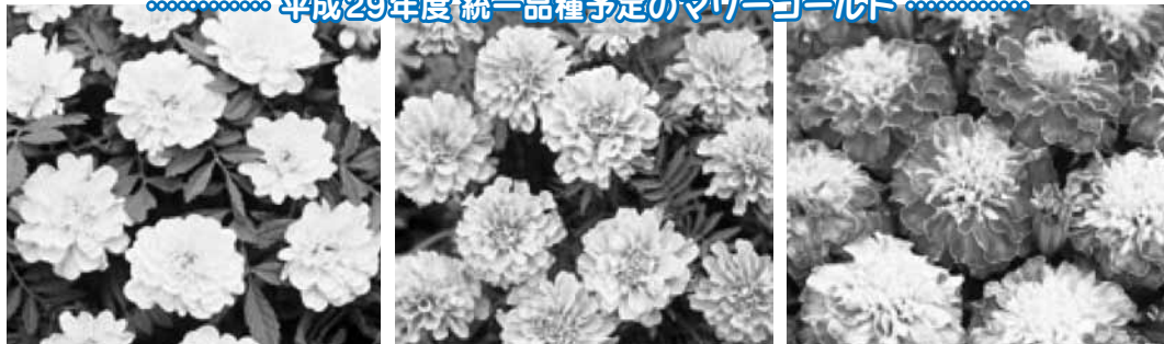
平成29年度統一品種予定のマリーゴールド

賛同頂ける団体は：住民税務課生活環境係（000-25552）までご連絡ください。