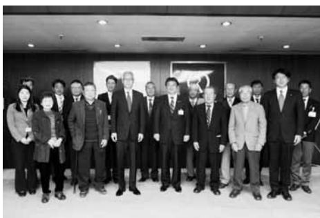
府中市長 表敬訪問

2日目は、午前中に味の素スタジアムを見学し、普段入ることのできないピッチ内や来賓席などを見学しました。午後には府中市長への表敬訪問を行い、町の印象や今後の両市町について話をし、改めて府中市を知ることのできた友好訪問となりました。