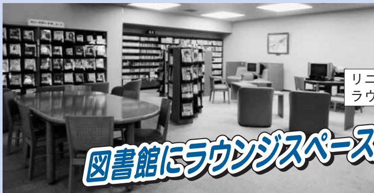
リニューアル後のラウンジスペース