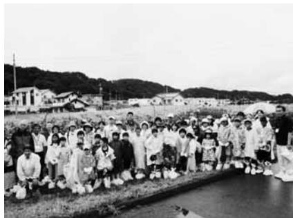
無事収穫できました!

8月2日に、毎年好評の「親子とうもろこし収穫体験」が行われ、府中市から45名の親子が訪れました。当日は、あいにくの雨模様でしたが、直前には雨も止み、やさしい倶楽部の皆さんにご協力をいただきながら、収穫することができました。昼食時には、採れたとうもろこしを茹でて参加した皆さんに味わっていただきました。