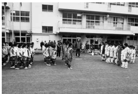
サッカーを通じた交流

午前中は、府中市立第八小学校のサッカーチームと交流試合を行いました。楽しみながらも真剣に試合を行い、汗を流しながら交流することができました。