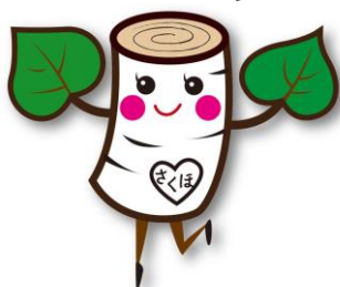
町公式キャラクター しらかばちゃん