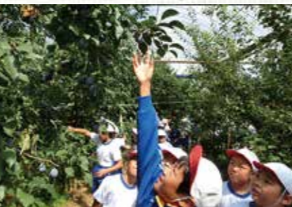
キャリア教育 (ふるさと学習) 地域に密着しながら、ふるさと学習からキャリア教育まで、9年間を通して実施しています。