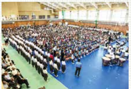
小中一貫教育 5年生から教科担任を段階的に導入するなど、9年間見通した指導カリキュラムを実施しています。