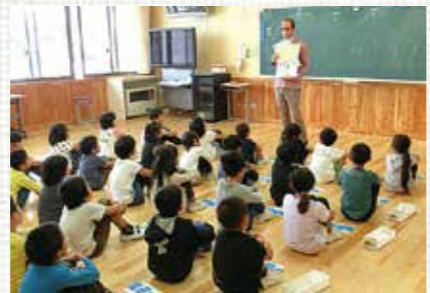
英語教育 小学校に英語科を設置して、9年間の独自英語カリキュラムで担任と NLT によるチームティーチングを実施しています。